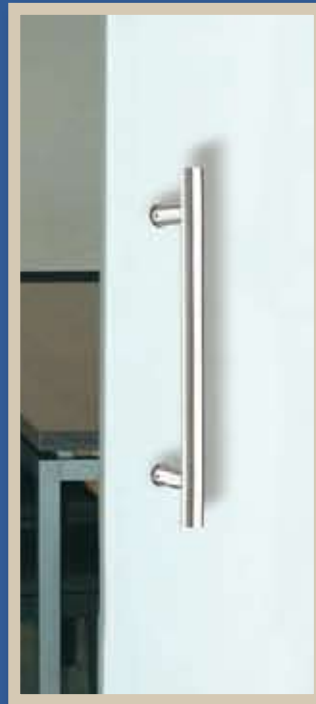
greep ref. 017433 400 mm x 25 mm