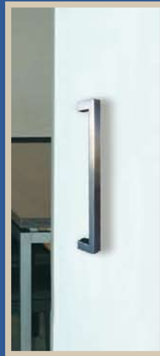
greep ref. 263465 319 mm x 20 mm x 20 mm