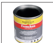
hechtmiddel produit de suturage Ref. 772639

Les blocs-portes ne peuvent être montés que dans des murs stables et bâtiments secs (max. 10% d'humidité murale).